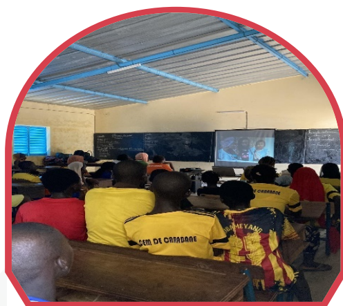
Projection-débat au CEM de Carane

L'utilisation de l'éducativité avec la série "C'est la vie" et le coffret pédagogique du Réseau Africain de l'Éducation, de la Santé et de la Citoyenneté (RAES) est un parfait exemple. Par un phénomène d'identification aux personnages et aux situations, les jeunes sont capables de décontextualiser et recontextualiser pour transposer les apprentissages dans leur propre vie et de verbaliser à leurs pairs. De même, le recours à des « jeux sérieux » (par exemple : jeux de relais lors duquel les enfants doivent répondre à des questions sur la puberté et l'hygiène) permet d'aborder sans blocage les questions fondamentales sur la puberté, l'hygiène intime, le consentement et les violences faites aux femmes.