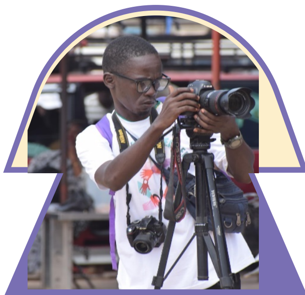
Prise d'image lors d'un événement Elle=Il

Cette bonne pratique pourra être reproduite à grande échelle dès la fin du programme. En effet, dans le processus de capitalisation, un kit de mise en œuvre complet (aspect administratif, financier et support pédagogique) sera édité pour permettre à d'autres organisations de reproduire le programme avec un guide "clé en main". Un film documentaire sera également réalisé pour illustrer et promouvoir le programme.